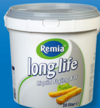
Remia Pflanzenfett halbflüssig, long life 10-Liter-Eimer