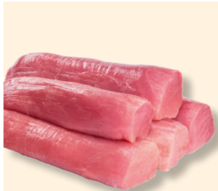
Schweine-Filet ohne Kopf & ohne Kette gefroren per kg