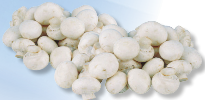
Polen Frische Champignons Kleine oder mittlere Köpfe lose, KL. I, per kg