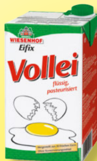
Wiesenhof Eifix Vollei 1-Liter-Packung