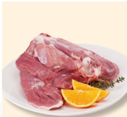
Frische Puten- Oberkeule per kg