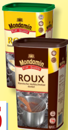
Mondamin Roux Mehlschwitze hell oder dunkel 1-kg-Dose je