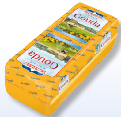
Gut von Holstein Gouda Brot halbfester Schnittkäse 45% Fett i. Tr., ca. 3,6 kg per kg