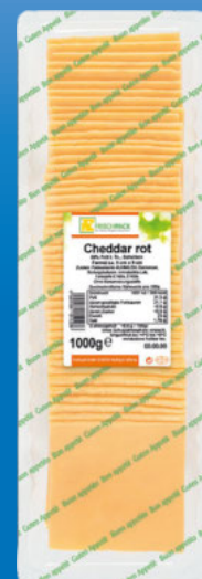
Frischpack Cheddar rot in Scheiben gefächert 50% Fett in Tr. 1000-g-Packung