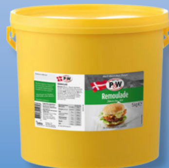
P & W Dänische Remoulade 5-kg-Eimer