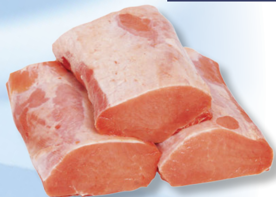
Schweine-Lachs gefroren per kg