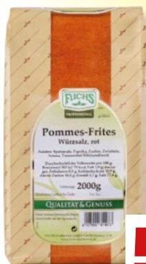
Fuchs Pommes-Frites Würzsalz 2-kg-Packung