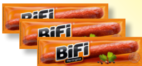
BiFi Original Mini 40 x 22,5-g-Packung Stück