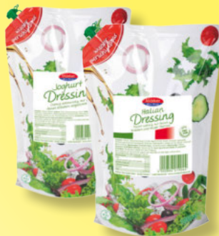
Märker Salat- Dressing versch. Sorten 1-Liter-Beutel je