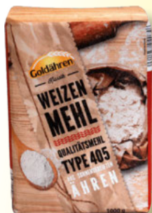
Goldähren Weizenmehl Type 405 1-kg-Packung