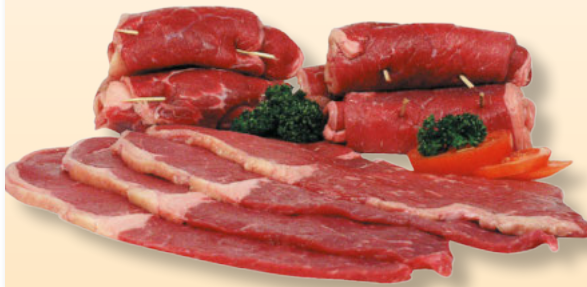
Frische Rinder-Rouladen aus der Unterschale per kg