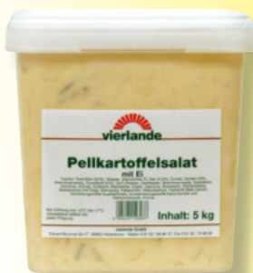
Vierlande Pell- kartoffelsalat 5-kg-Eimer