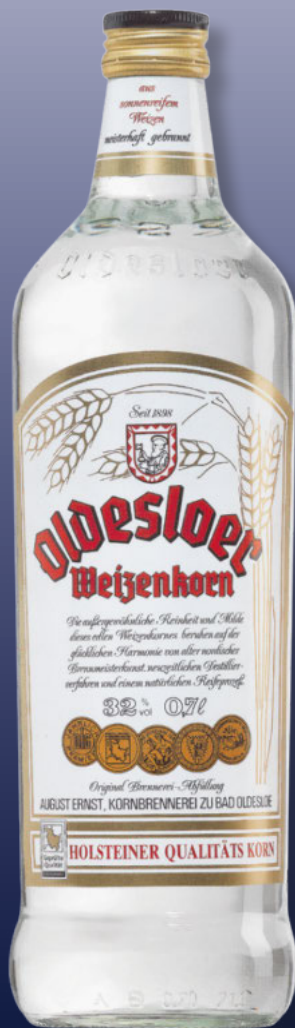
Oldesloer Weizenkorn 32% vol. 0,7-Liter-Flasche