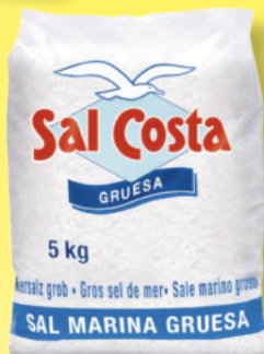
Sal Costa Meersalz grob 5-kg-Sack