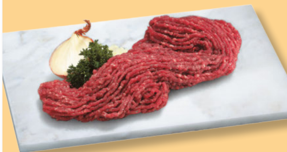
Frisches Rinder- Hackfleisch per kg