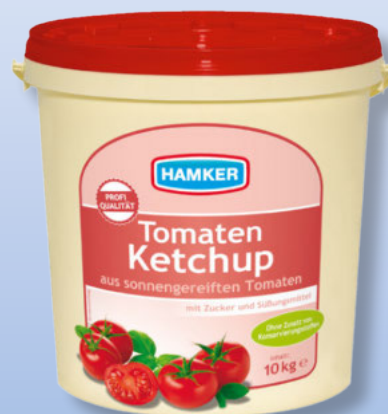
Hamker Tomaten- oder Curry- Gewürzketchup 10-kg-Eimer je