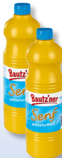
Bautz'ner Senf mittelscharf 1-kg-Flasche