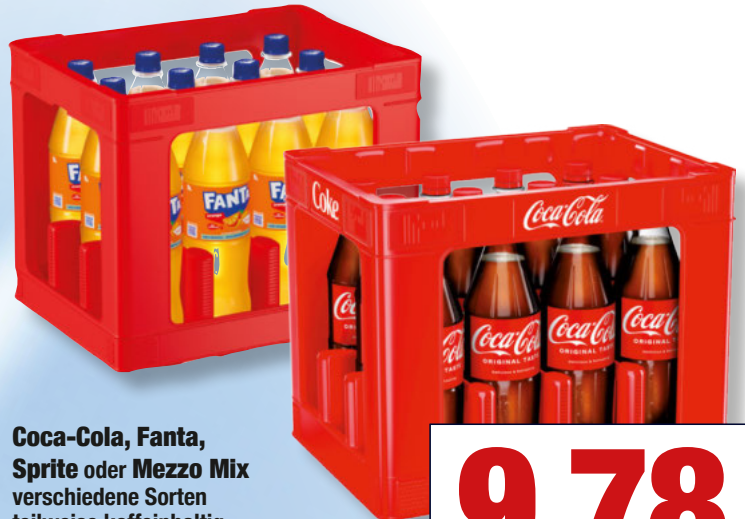
Coca-Cola, Fanta, Sprite oder Mezzo Mix verschiedene Sorten teilweise koffeinhaltig 12/1 Liter Kiste je + Pfand

Besuchen Sie uns auch im Internet: www.belacundc.de