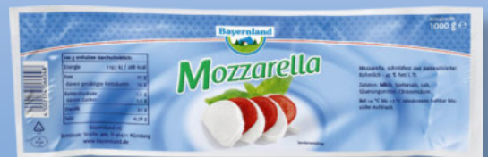
Bayernland Mozzarella Brot 45 % Fett i. Tr., 1000-g-Packung