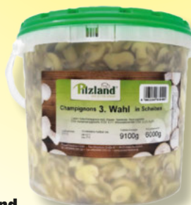
Pilzland Champignons in Scheiben 3.Wahl 10-Liter Eimer