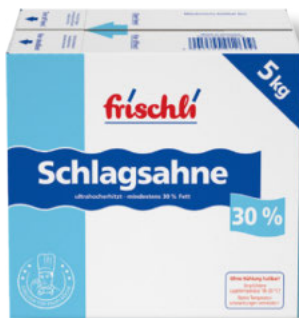
Frischli H-Schlagsahne 30% Fett 5-kg, per kg