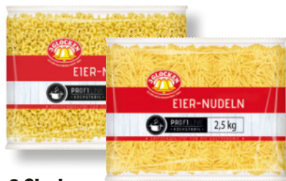
3 Glocken feine Eier-Nudeln verschiedene Sorten 2,5-kg-Beutel je