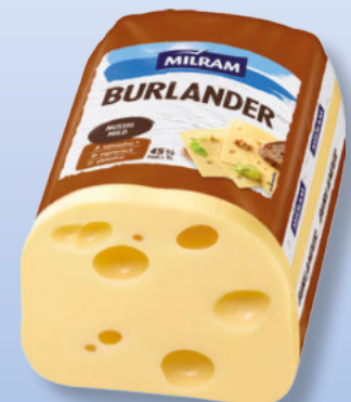
Milram Burlander deutscher Schnittkäse 45% Fett i. Tr., ca. 3 kg, per kg