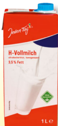
Jeden Tag H-Milch 3,5% 1-Liter-Packung