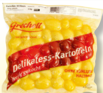
Grocholl Delikatess-Kartoffeln 30-50 mm 6-kg-Beutel