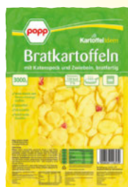
Popp Bratkartoffeln mit Speck und Zwiebeln 3-kg-Packung