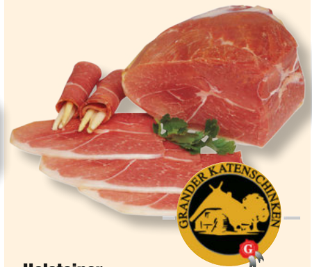
Holsteiner Katenschinken mit Schwarte aus der Pape per kg