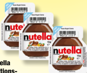
nutella Portions- Nussnougataufstrich 120 x 15-g Packung