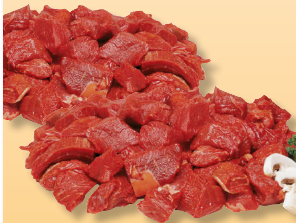
Rinder-Gulasch aus der Unterschale per kg