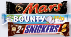
Mars 2er-Pack King Size, Snickers 2er-Pack Big One, Twix Xtra oder Bounty Trio 2/3er/70-85,5 g Packung je