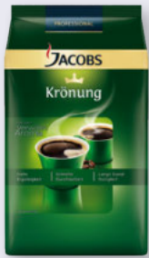
Jacobs Krönung 1000-g-Packung