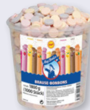
Frigeo Brause Bonbon 1000er-Dose