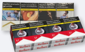
Marlboro Red oder Gold XL-Box 8 x 22er- Stange je