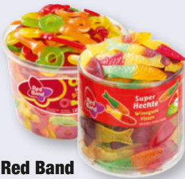
Red Band Weingummi verschiedene Sorten 100er-Dose je