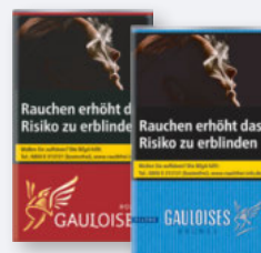
Gauloises Blondes Red oder Blue L-Box 10 x 20er- Stange je