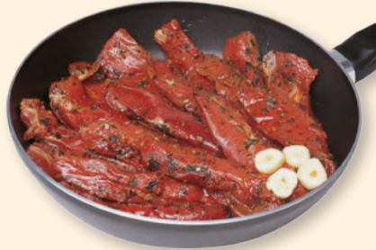
Neuseeland Lamm-Filet gefroren per kg