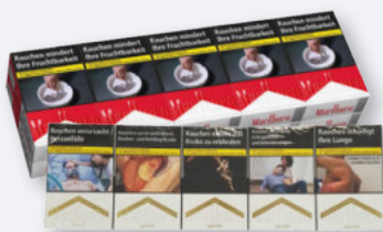
Marlboro Red oder Gold L-Box 10 x 20er- Stange je

100er Packung 26 x 26 x 4 cm 21.98 € 29 x 29 x 4 cm 26.98 € 30 x 30 x 4 cm 27.98 € 33 x 33 x 4 cm 32.48 €