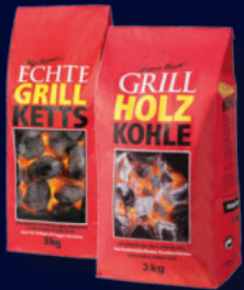
Grill Ketts oder Grill Holzkohle 3-kg-Beutel je

Wyker Straße 19-25 Tel.: 04331 / 46 72 15 FAX: 04331 / 46 72 14 Schlachtereitell.: 04331 / 46 72 16