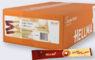
Hellma Zucker Sticks 1000 x 4-g-Karton