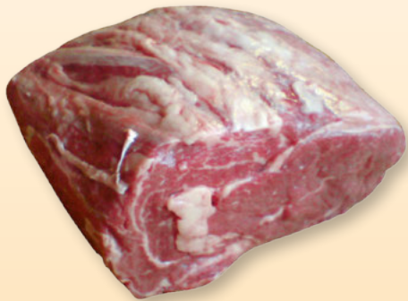
Paraguay Entrecote per kg