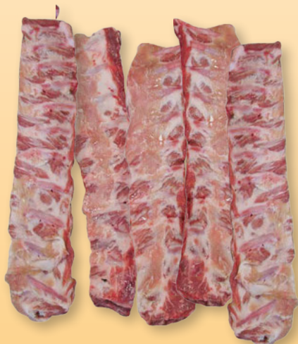
Schweine- Kotelettrippen gefroren per kg