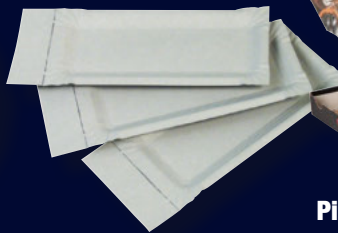
Pappeller mit Abriss, 8 x 18 cm 250er Packung