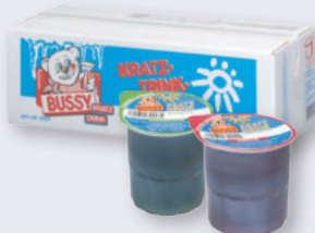
Bussy Kratzdrink verschiedene Sorten 40 x 200 ml Karton