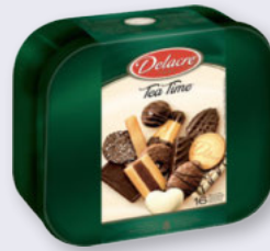
Delacre Tea-Time Gebäckmischung 1000-g-Dose