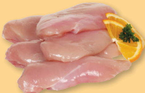
Frische Hähnchenbrust ohne Haut und ohne Knochen per kg