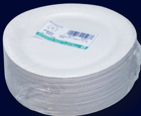
Imbißteller rund 23 cm Durchmesser 100er Packung