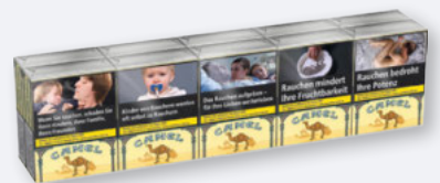
Camel Yellow Filter 10 x 20er- Stange